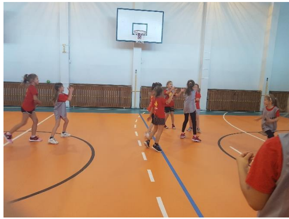
Ludowy Zespół Sportowy „ZRYW” Rzeszyca