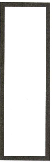
(własnoręczny podpis wnioskodawcy (nie wykraczać poza ramkę))